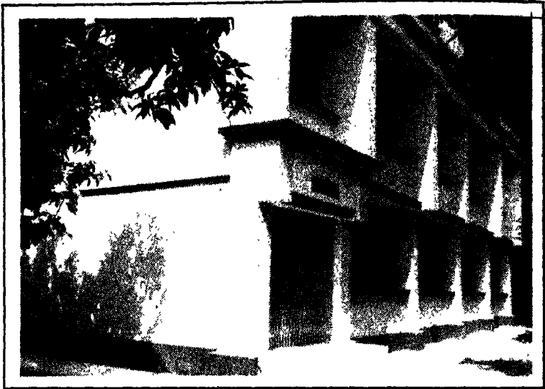
(राजयशसूरि विद्याभवन की भव्य इमारत)